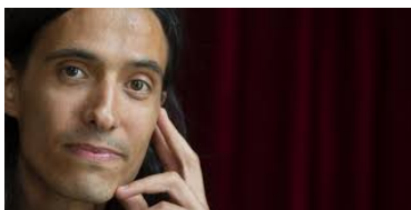
Jonas Hassen Khemiri