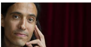
Jonas Hassen Khemiri